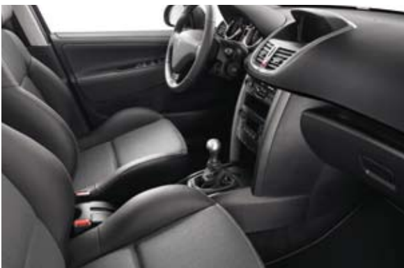
Polu-koža sa tkaninom Payenne Siva Mystère (2) – Dostupno samo kod 207 SW RC