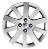
Felne Hockenheim 17*** (nemogućnost postavljanja lanaca za sneg)