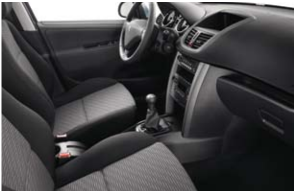
Tkanina sa dezenom SPA Crna Mistral* – Dostupno kod nivoa Premium