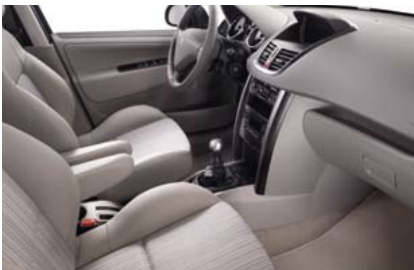
Polu-koža Salsa Bež-siva (2)** – Dostupno kod Feline