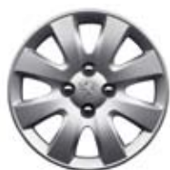
Ratkapne Hobart 15**