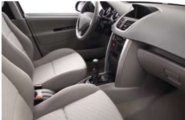
Tkanina sa dezenom SPA Bež-siva** – Dostupno kod nivoa Premium

*Dostupno kod berline i SW-a u zavisnosti od verzije. **Dostupno samo kod berline.