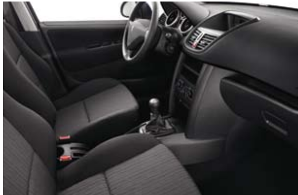
Tkanina sa dezenom Savana Crna Mistral* – Dostupno kod nivoa Urban