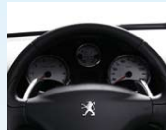
Brojčanici za merenje brzine dostupni su sa menjačem 2-Tronic (BVM5).