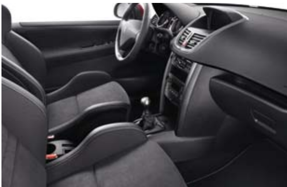
Sedišta tipa kadiće sa 3 vrste tkanine Crna Alcantara ® – Dostupno samo kod 207 RC Tkanina Méllia Bež-siva Criollo – Dostupno samo kod SW Outdoor