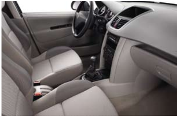
Tkanina sa dezenom Chilico Bež-siva* – Dostupno kod nivoa Active