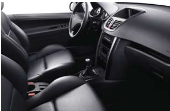
U okviru dodatne opreme perforirana koža Crna Mistral (1)*