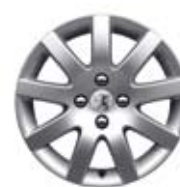
Felne Estoril 16**