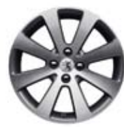
Felne Melbourne 17**** (nemogućnost postavljanja lanaca za sneg)