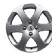
Felne Outdoor 16**** (nemogućnost postavljanja lanaca za sneg)

*Dostupno kod berline i SW-a, u zavisnosti od verzije. **Dostupno samo kod berline, u zavisnosti od verzije. ***Dostupno samo na nivou RC. ****Dostupno samo na nivou SW Outdoor.