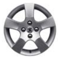
Felne Canberra 16**