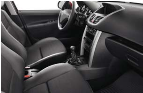
Tkanina Crna Méilla – Dostupno samo kod nivoa SW Outdoor