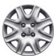
Ratkapne Brisbane 15**