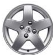
Felne Monaco 15**