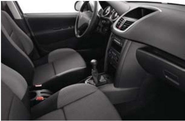
Tkanina sa dezenom Chilico Crna Mistral* – Dostupno kod nivoa Active