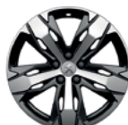
Aluminijumska felna 18" LOS ANGELES