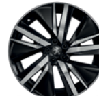
Aluminijumska felna 19" SAN FRANCISCO