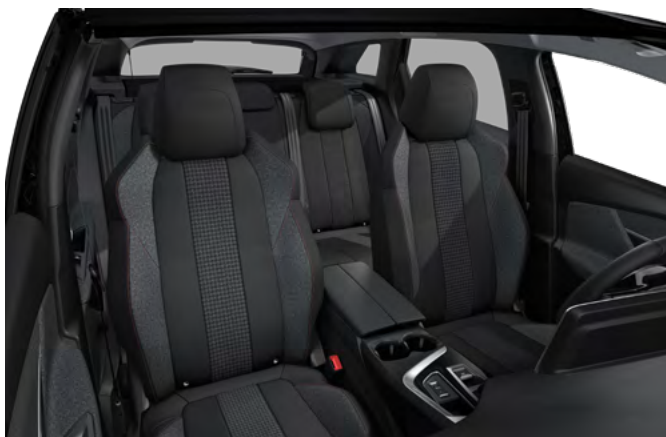
Tamna unutrašnjost od tkanine Meco