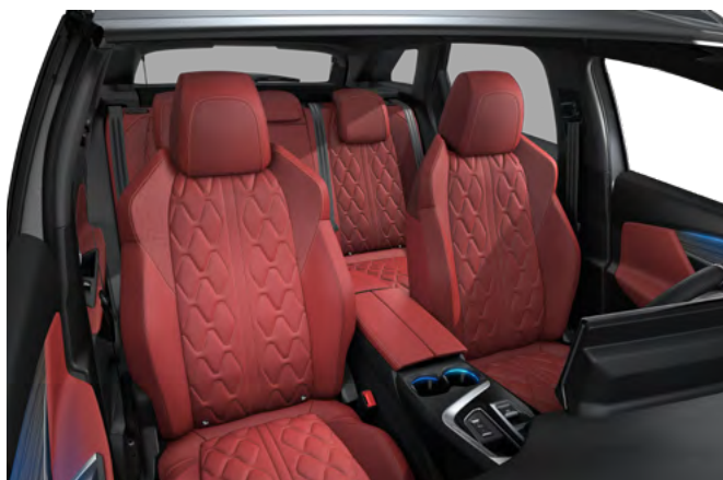
Nappa crvena kožna unutrašnjost sa "Aikinite" šavom