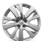
Aluminijumska felna 17" CHICAGO