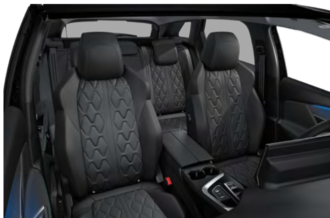
Nappa crna kožna unutrašnjost sa "Tramontane" šavom