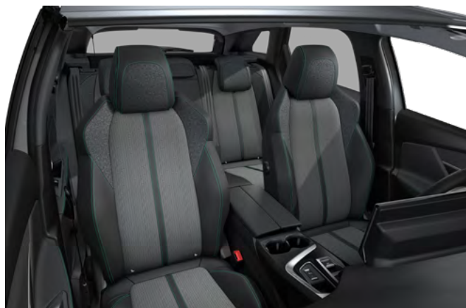
Unutrašnjost u kombinaciji "Leatherette" sa "Colyn" platnom i Mint šavom