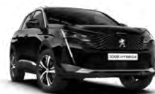
Crna Perla Nera