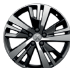
Aluminijumska felna 18" DETROIT