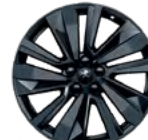
Aluminijumska felna 19" WASHINGTON