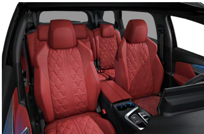
Nappa crvena kožna unutrašnjost sa "Aikinite" šavom