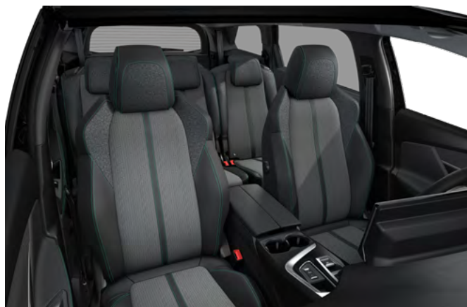
Unutrašnjost u kombinaciji "Leatherette" sa "Colyn" platnom i Mint šavom