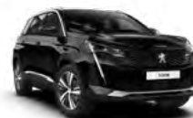
Crna Perla Nera