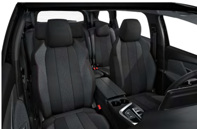
Tamna unutrašnjost od tkanine Meco