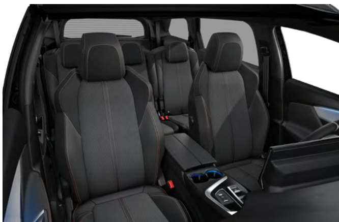
Unutrašnjost u kombinaciji TEP sa "Belomka" platnom i Aikinite šavom