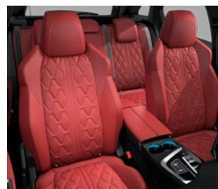
Nappa koža u crvenoj boji