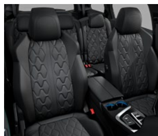
Nappa koža u crnoj boji